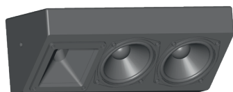
SCL 2510 TS 40